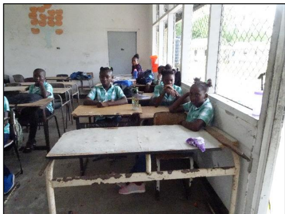
Leerlingen van basisschool Akontoe Velantie